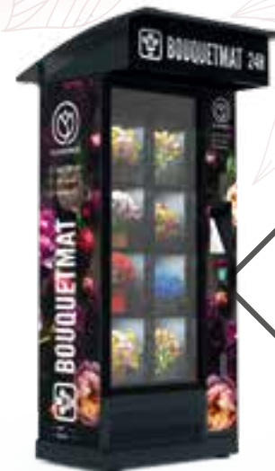
BOUQUETMAT ONE K8 STANDARD