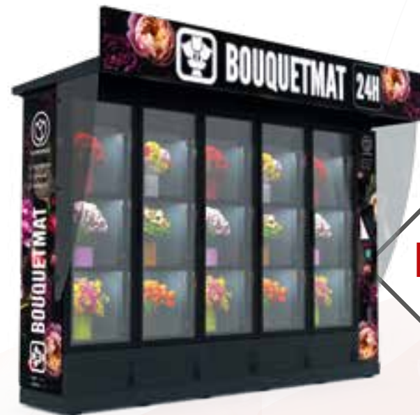
BOUQUETMAT K15 PRO