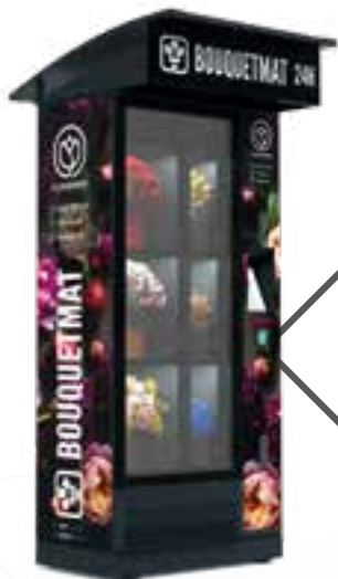
BOUQUETMAT ONE K6 STANDARD