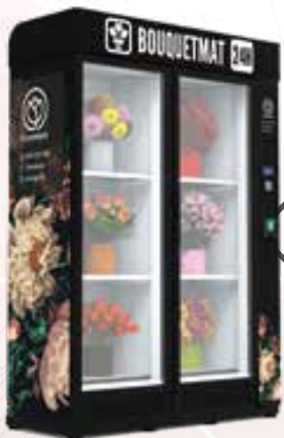
BOUQUETMAT K6 BASIC