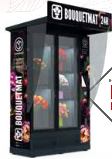
BOUQUETMAT K5 PRO