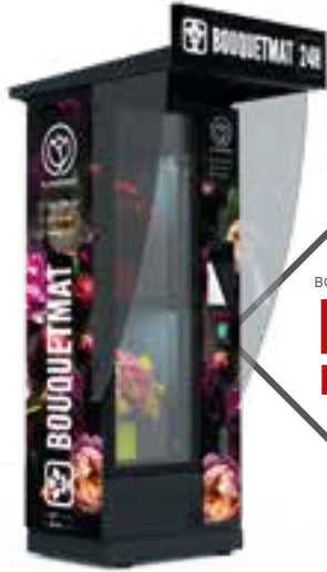
BOUQUETMAT K2 PRO