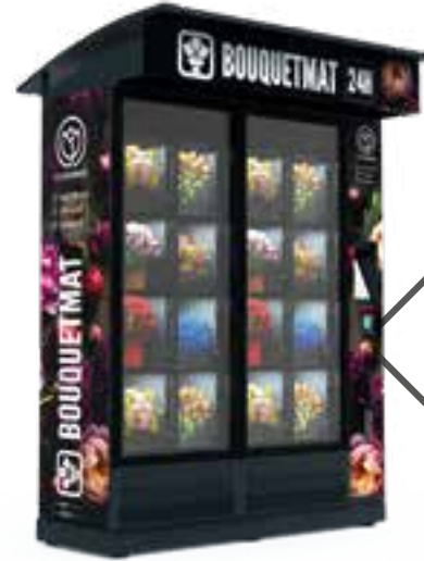
BOUQUETMAT ONE K16 STANDARD