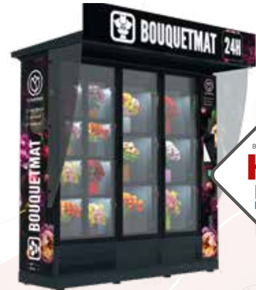
BOUQUETMAT K14 PRO HYBRID