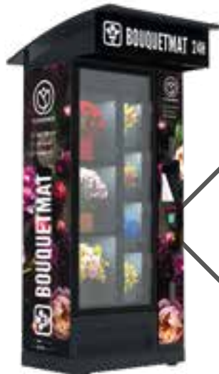
BOUQUETMAT ONE K7 STANDARD