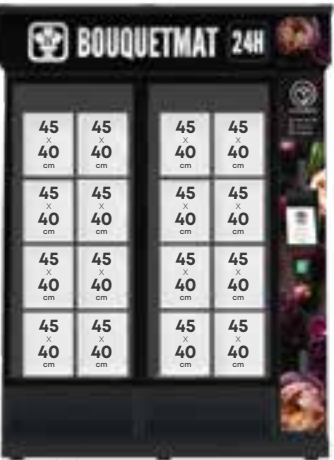
(height x width) | (wysokość x szerokość) | (breite x höhe) | (ancho x alto)

Układ i wymiary szafek Anordnung und Maße von Boxen Configuración y dimensiones de las cajas