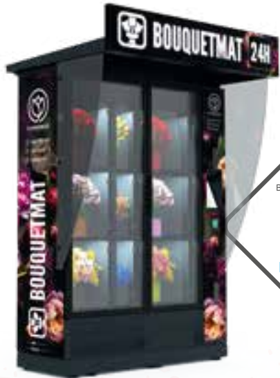
BOUQUETMAT K9 PRO HYBRID