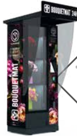
BOUQUETMAT K3 PRO