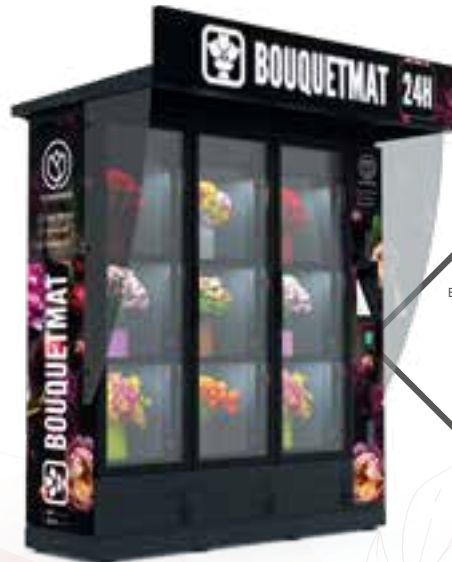
BOUQUETMAT K8 PRO