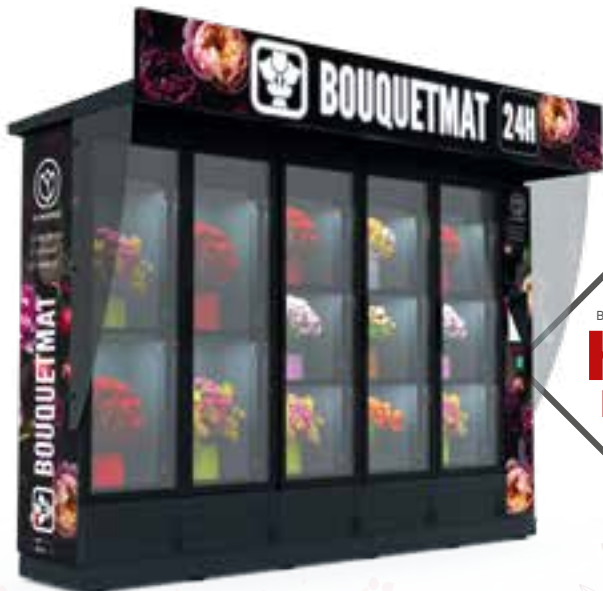
BOUQUETMAT K13 PRO