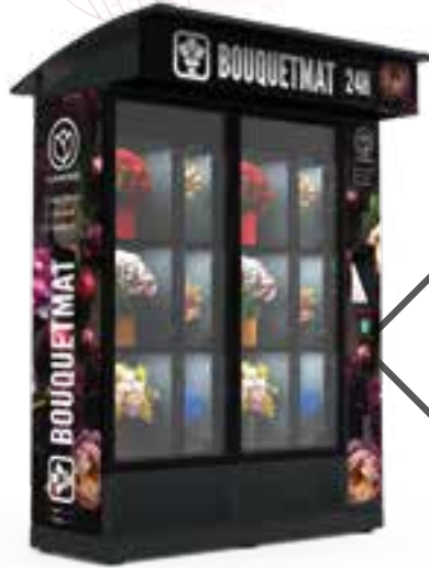
BOUQUETMAT ONE K12 STANDARD