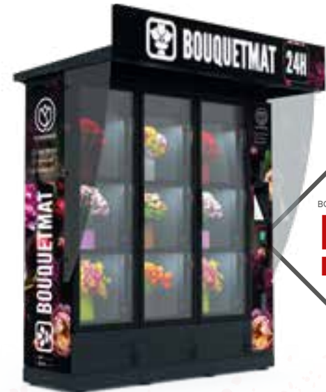
BOUQUETMAT K9 PRO