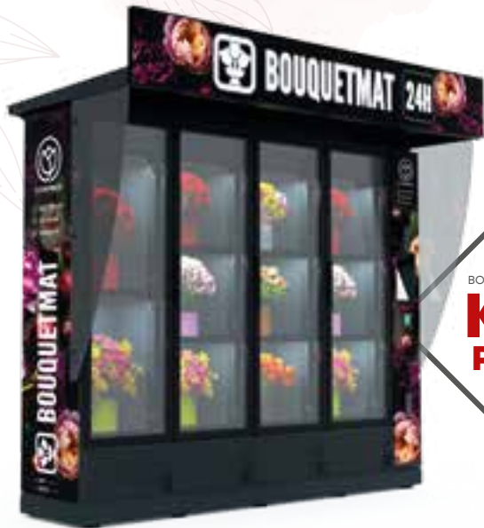
BOUQUETMAT K11 PRO