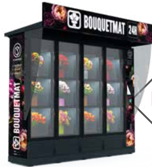
BOUQUETMAT K12 PRO