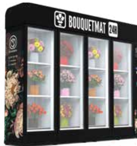
BOUQUETMAT K12 LITE ALL SEASONS