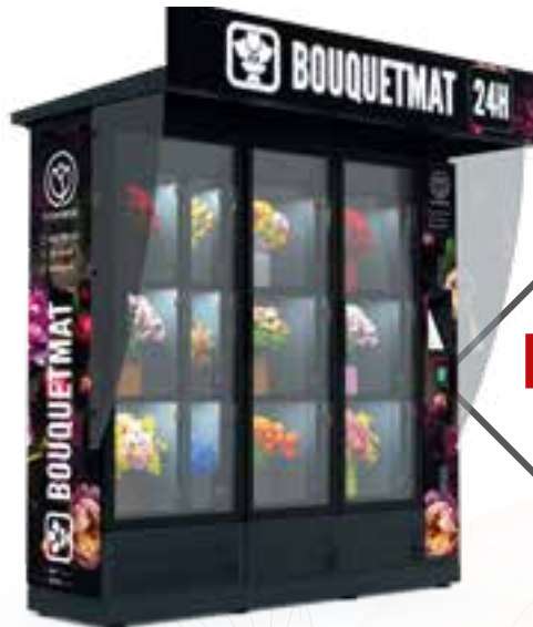
BOUQUETMAT K12 PRO HYBRID