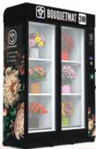
BOUQUETMAT K6 LITE ALL SEASONS