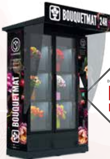
BOUQUETMAT K6 PRO